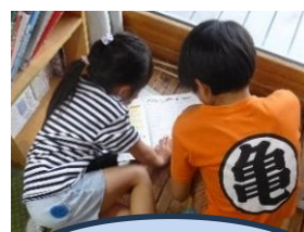
カナヘビ捕獲大作戦