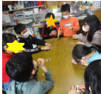
人狼カードゲーム