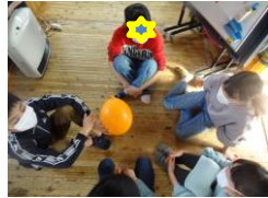
風船爆弾 * ?